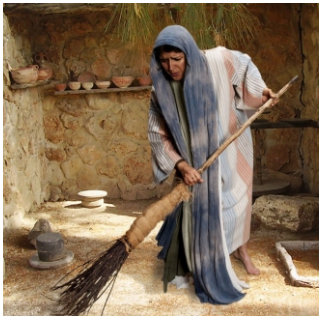
காணாமல் போன வெள்ளிக்காசு