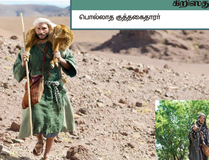
காணாமல் போன ஆடு